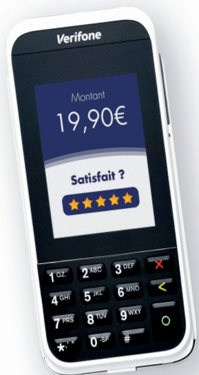
Le nouveau TPE e285p

Le paiement à table : Connecté directement au système de caisse L'Addition, le Paiement à Table propose aux clients de régler par QR code à table, depuis leur smartphone. Le client a ensuite accès à son ticket de caisse et son justificatif directement sur son smartphone, sans besoin d'impression.